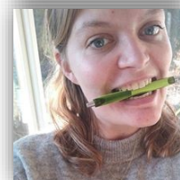
Birgitte Kranio Sakral Terapi